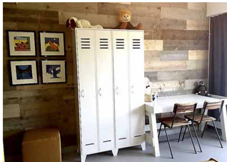
De vernieuwde familiekamer.