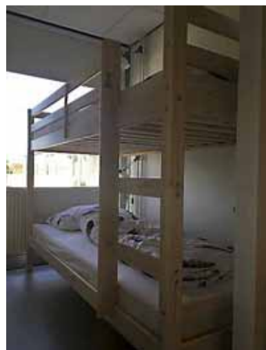
Een stapelbed.